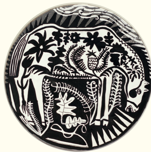
Maybe Next Time