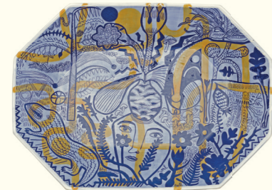
Conscious Dreaming Dysgl

Mae printiau breuddwydiol Penn yn llawn storiâu swreal, rhywbeth a'n denodd ni ar unwaith, gyda'i harddull yn dod yn uniongyrchol o'i llaw. Mae cerameg Richards yn wahanol iawn, yn fyfyrddau tawel ochr yn ochr ag ynni gwyllt Penn. Mae ei lliwiau a'i phatrymau gofalus yn cael eu rhoi ar botiau sy'n gynnil ond eto'n gymhleth.'